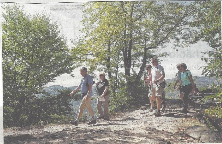
Der neue Wanderweg „Dunkelsteinerwald Runde“ wird am 20. September eröffnet